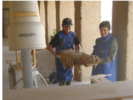
Vorbereitung einer Untersuchung

Bereits in pharaonischer Zeit lagen in Ägypten erstaunliche medizinische Kenntnisse vor; und das Jahrtausende vor dem berühmten griechischen Arzt Hippokrates. Vor allem Papyri und diverse Fundstücke weisen darauf hin, welches Wissen vorhanden war und welchen Einfluss auch die Magie hatte. Dies, und die Ausbildung von Ärzten in altägyptischer Zeit wird in dem Vortrag beleuchtet. Zudem werden auch neueste Grabungsergebnisse vorgestellt und analysiert.