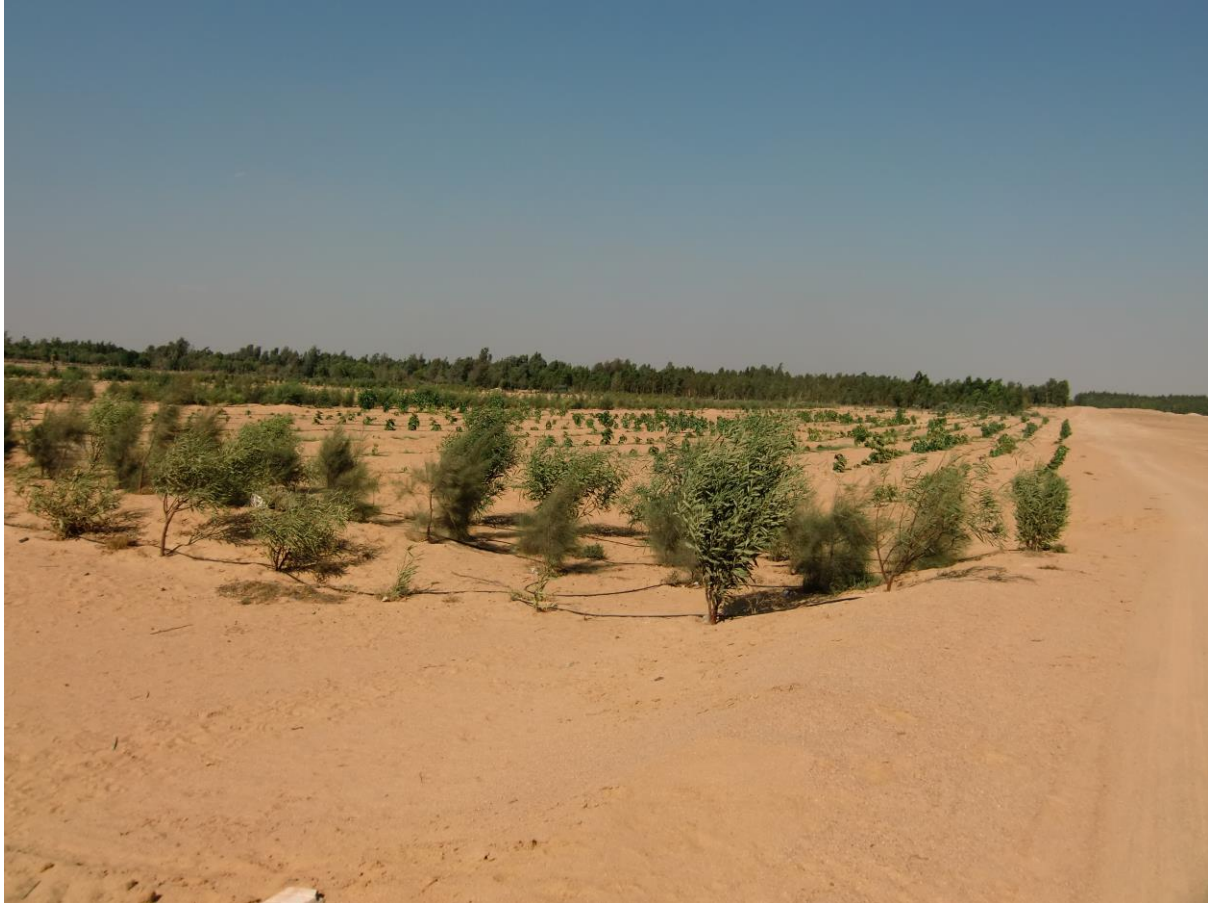
Aufforstung in Wüstengebieten - ein halbes Jahr nach der Pflanzung

Vortragender: Herr Hany El-Kateb, Uni München