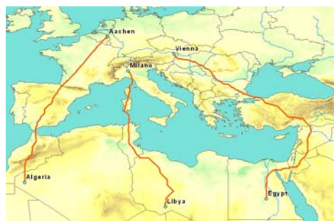
3 Leitungsbeispiele