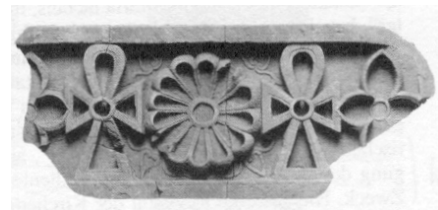
Ornament an einem Opferbecken um die Zeitenwende